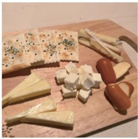
チーズの盛り合わせ