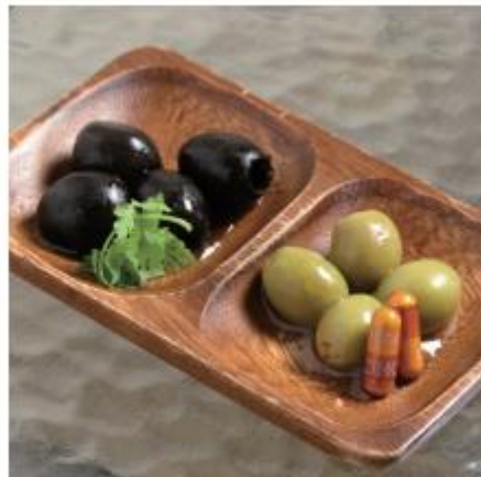
オリーブの盛り合わせ