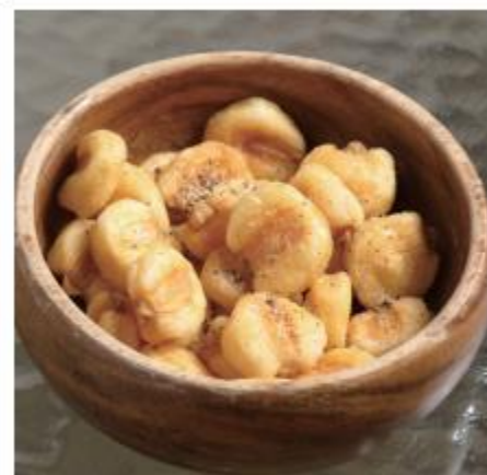
ジャイアントコーン