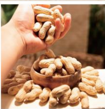
追加の落花生 握り潰し