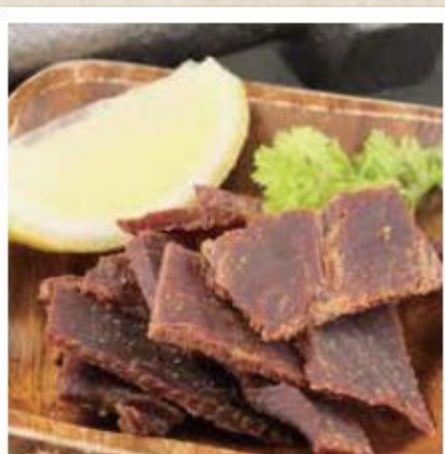
ビーフジャーキー